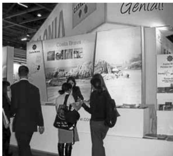
El Patronat de Turisme de Girona es promociona en diverses fires internacionals. A la imatge, a Londres, l'any passat.

Des d'avui fins al 13 de maig, el conjunt de l'oferta turística de la demarcació serà present en la fira Expovacaciones de Bilbao, en què participaran dins l'estand de Catalunya amb diverses entitats gironines: Roses, l'Escala-Empúries, Castell-Platja d'Aro, Blanes i la Vall d'en Bas. L'associació turística de Palafrugell, l'Associació d'Estacions Nàutiques de Catalunya i Petits Grans Hotels de Catalunya també assistiran a la mostra, que rep uns 240.000 visitants.