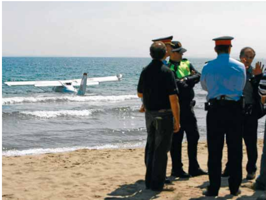
La policia local i els Mossos, a la platja de Roses, ahir al migdia, amb alguns testimonis

ATRAPAT • El jove reporter no va poder sortir a temps de l'aparell i el pilot en va resultar il·lès ■ P39