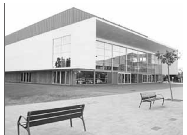
L'Espai Ter, un espai multidisciplinari que es comença a omplir de contingut