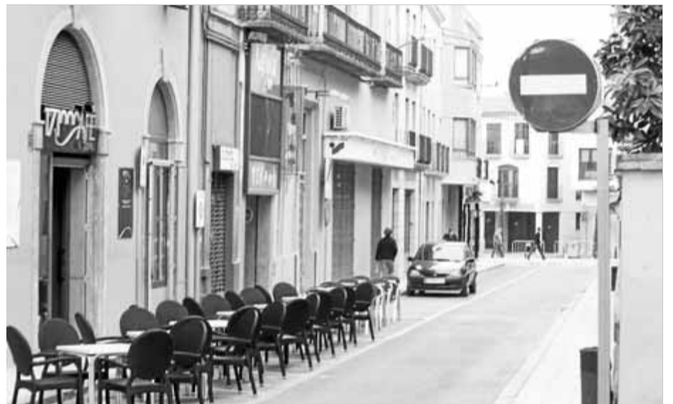
Carrer dels Valls, a la Bisbal d'Empordà

Amb la Biblioteca, l'Ajuntament ha intentat que s'alentissin les obres. "Volíem que es baixés el ritme per allargar més els pagaments, però no ens en