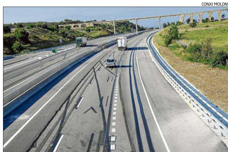
La via va romandre tallada a l'alçada del quilòmetre 24.