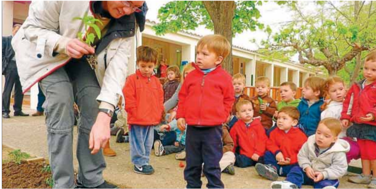
Nens de la llar d'infants municipal La Balca de Banyoles, en una imatge d'arxiu

El regidor d'Educació de Salt, Rober Fàbregas, ha manifestat que segueixen endavant amb la preinscripció, però que estaran a l'expectativa, de manera que si les previsions a la baixa que havien fet ini-