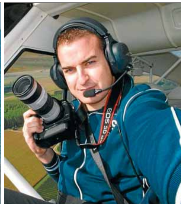
L'avioneta accidentada, davant la platja de Roses. A la dreta, una imatge d'arxiu del fotògraf Jordi Velasco durant un reportatge aeri ■ LLUÍS SERRAT