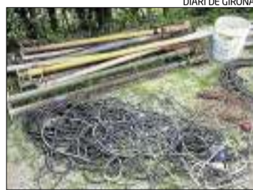
Part del material sostret.