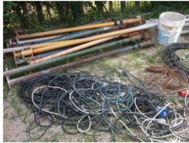
Havien estat sostrets el passat cap de setmana d'un solar en obres del carrer Antoni Canals del municipi Ajuntament de Roses

La recuperació d'aquest material ha estat possible gràcies a la detecció per part d'una patrulla de la Policia Local rosinca, un cotxe mal estacionat que contenia material d'obra divers. Davant la conducta sospitosa del conductor en veure la patrulla, i el fet que aquest no disposés de la documentació del vehicle ni sabés donar raó del material que transportava, els agents van procedir al trasllat del cotxe al dipòsit policial.