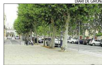
Un dels punts on està previst.

► El consistori espera poder fer-ho abans de Sant Joan, després d'adjudicar-ho a la tercera empresa concursant