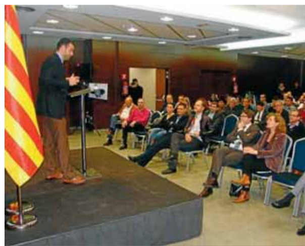
L'acte d'ahir de CiU i Rcat a l'Ultònia de Girona

hem de fer confiança a Mas, que és qui ha de capitalitzar el procés". Tant Vila com Puigdemont van agrair aquest gest. El cap de llista de CiU va afirmar que "la història ha donat lliçons, i en moments transcendentals com aquest hem estat petits. Ara el model de progrés i benestar està en risc, i Reagrupament ha sigut generós", i hi va afegir que "s'ha de fer costat al compromís que ha pres el president Mas". Puigdemont va insistir en aquesta línia: "Als patriotes que estan disposats a tot per el país, els demanem el vot en aquestes eleccions, perquè CiU permetrà aconseguir la independència." ■