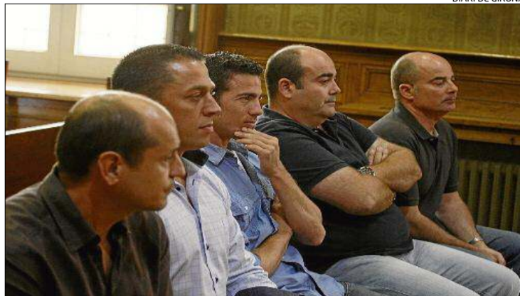
Els acusats durant la primera sessió del judici oral a l'Audiència.