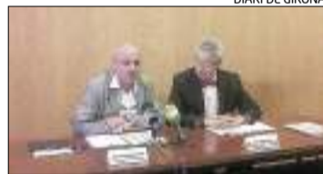
La firma del conveni.