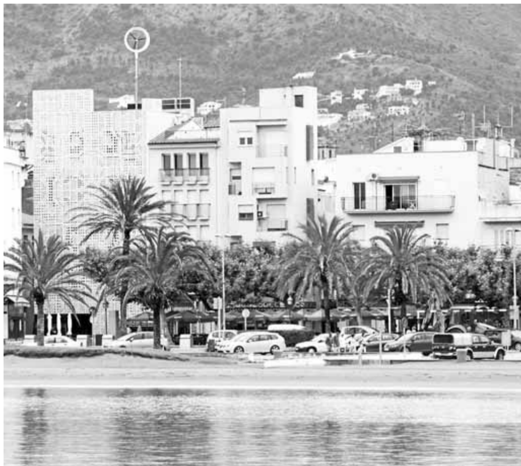
El front de mar de Roses, amb la controvertida façana de Ca l'Anita i el molí de vent dalt de l'edifici, que actualment ja no hi és perquè la tramuntana el va fer caure

La crispació entre govern i oposició es concentra, doncs, en l'ús que s'ha de fer de tres edificis públics: Ca l'Anita, l'ajuntament vell i la seu de la SUF. El PSC va renovar els dos primers i va preparar un projecte per al tercer. Ara, però, el nou govern considera que cal fer un replantejament complet de quin ús es pot fer d'aquests locals, tenint en compte els costos de manteniment que això implicarà, i el futur dels tres edificis ha quedat encallat. Les discrepàncies van fins a qüestionar la polèmica façana tot just acabada de Ca l'Anita: un nyap urbanístic pels uns, un exemple d'arquitectura que ha estat premiada pels altres. La creació d'un nou pàrquing subterrani que el PSC plantejava a la plaça Catalunya i que CiU preferiria al passeig, i la urbanització del mateix passeig marítim són alguns dels