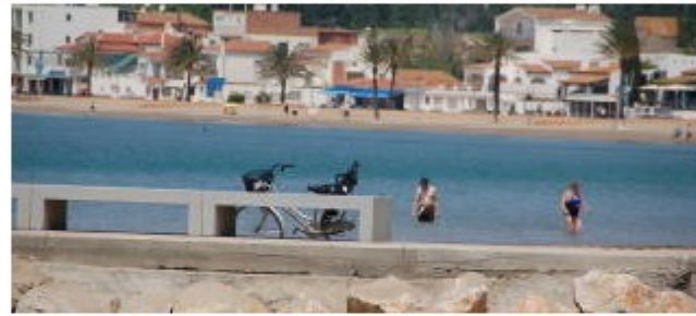
Roses prepara la campanya d'estiu per a fer-la més segura. SANTI COLL

EMPORDA.INFO El passat divendres es va reunir a Roses la Junta Local de Seguretat integrada per representants de Policia Local, Mossos d'Esquadra, Guàrdia Civil, Policia Nacional, l'alcalde de Roses i el regidor de Seguretat Ciutadana. El motiu de la reunió, que es realitza periòdicament a la població, va ser presentar les memòries de les tasques i resultats obtinguts en els primers mesos de l'any pels diferents cossos de seguretat en la seva actuació a Roses, així com definir els principals punts d'atenció i la coordinació policial de cares a la propera temporada d'estiu.