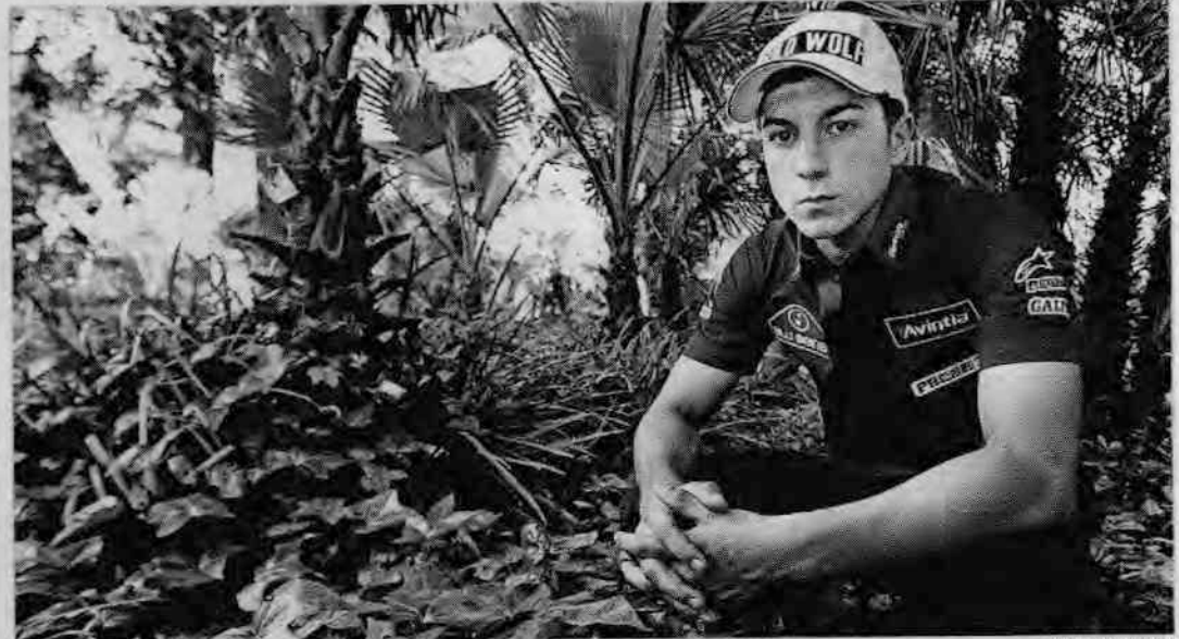
El piloto de Roses no acusa la presión; sólo piensa en ganar carreras

Lo veo muy abierto. Ahora ha vuelto a ganar Lorenzo pero creo que Stoner está a otro nivel y espero y deseo que Pedrosa llegue a ese nivel