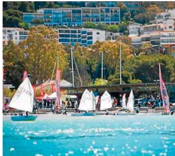
Una prova de referència a Roses