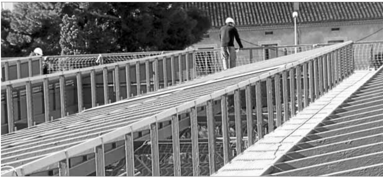
Una imatge de les plaques d'energia fotovoltaica de la plaça Catalunya de Figueres