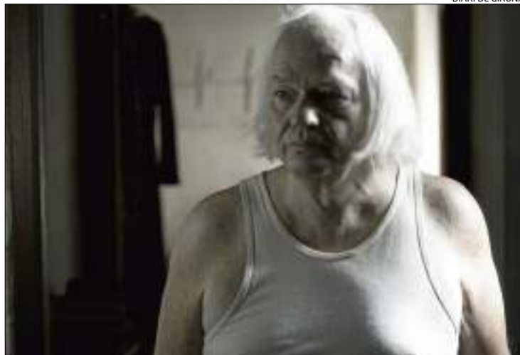
L'actor Lou Castel, en una escena del film «La lapidation».