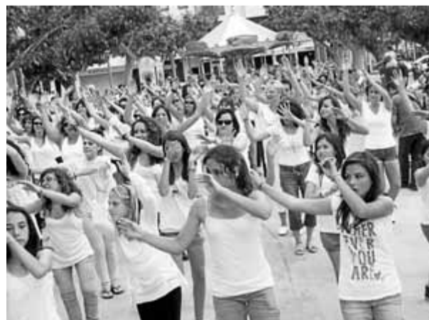
Algunes de les persones que van participar dissabte en la 'flash mob', a la plaça Catalunya de Roses

nitzats durant la Setmana Europea Contra el Càncer, organitzada per l'European Cancer League. Altres localitats catalanes que hi han participat són Vici Torrelló, que també han organitzat cadascuna una flash mob, amb la mateixa coreografia i al ritme de la