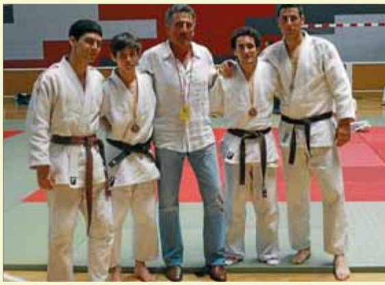
Els grupistes amb les medalles ■ EL 9