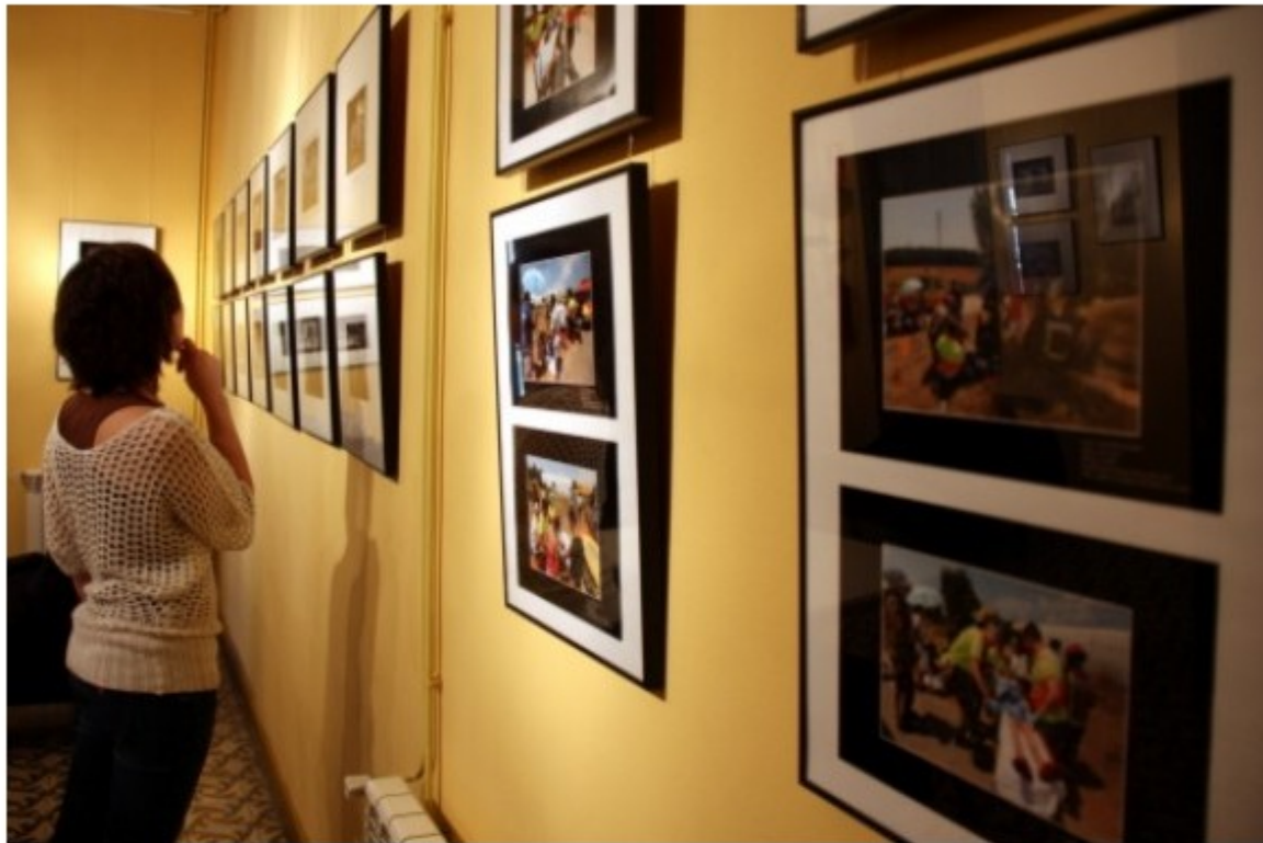
L'exposició 'Nou mirades a dotze mesos' es pot veure al Col·legi de Periodistes de Girona.

Societat ACN / Redacció | Actualitzat el 05/06/2012 a les 13:31h Els fotògrafs homenatjaran Jordi Velasco, que va morir l'11 de maig després de patir un accident d'avioneta