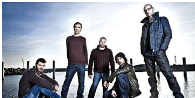
IX!. Els de Cadaqués presenten el seu últim disc, Immersió

DISSABTE , la sala s'omplirà de música explícitament rockera a càrrec dels cadaquesencs Ix!. Un