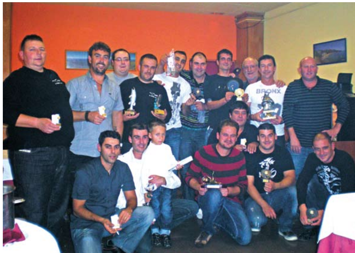
SEGONA EDICIÓ. A la imatge els premiats de la segona lliga després del sopar de final de temporada a Roses