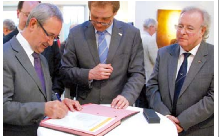
SIGNATURA. La relació entre Roses i Solingen plasmada en un document