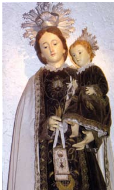
MARE DE DÉU DEL PORT. Segle XVII HN

Per perpetrar el robatori de la imatge de la capella del Port, els