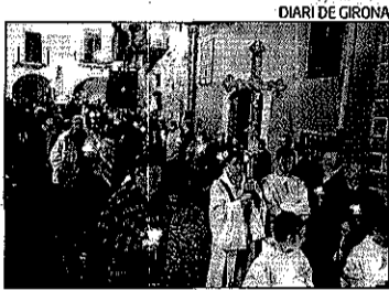
La processó de Peralada.

► Una cinquantena de persones participaran en l'activitat, que se celebrarà el 30 de març