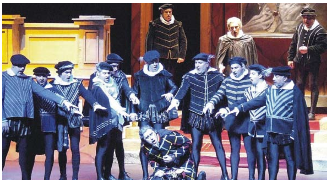
BELCANTO. Una imatge del muntatge que presenta la companyia Teatro Lírico d'Europa

província, a ciutats de la perifèria o a teatres de mitjà aforament amb muntatges com Il barbiere de Sevilla de Mozart, Don Giovanni i Le nozze di Figaro de Rossini o La Bohème de Puccini. Aquesta primavera aterren a Figueres amb Rigoletto , l'obra que va ser el primer gran èxit de Giuseppe Verdi, estre-