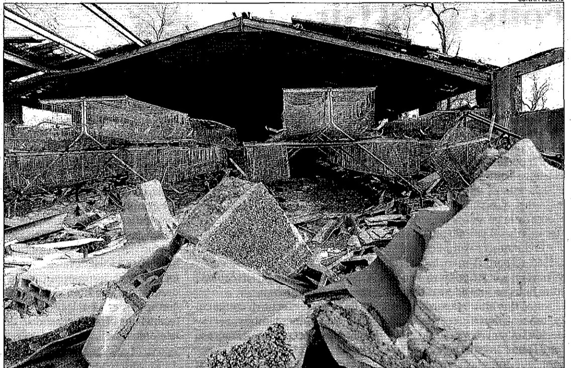
La granja abandonada que està al punt de mira de lladres que hi busquen material per robar.