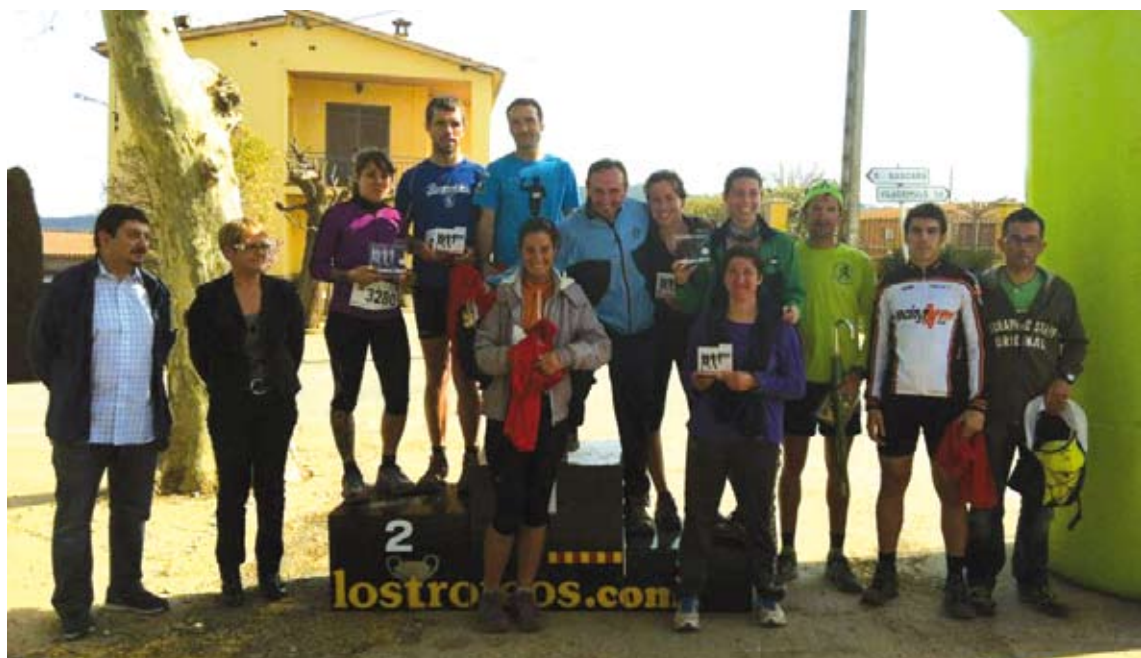
ELS CAMPIONS. A la imatge els primers classificats a la mitja maratón i als 14 km de Vilademuls