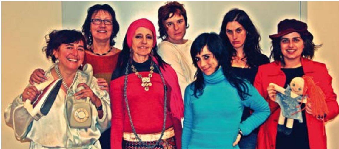
TEATRE. L'acte central serà la lectura d'un manifest