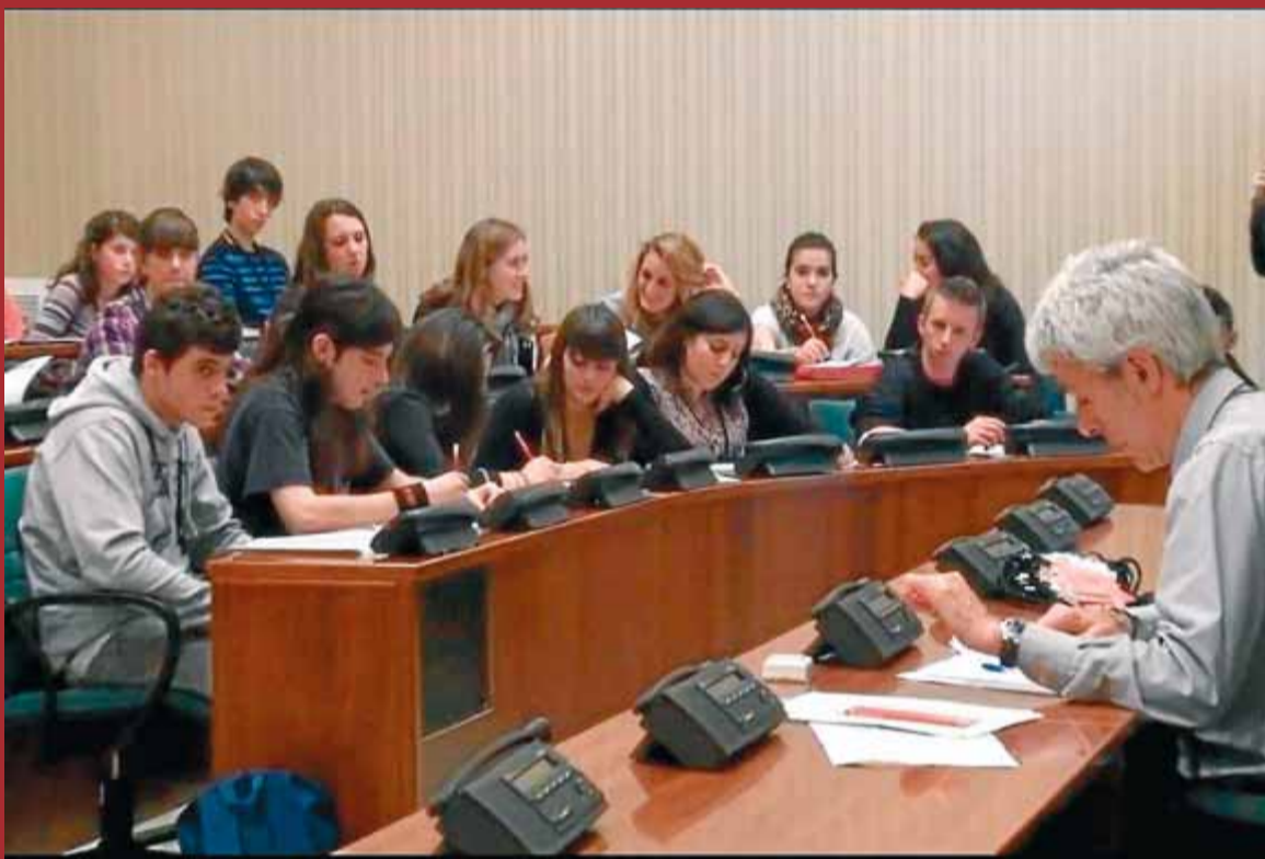
Alguns dels alumnes que participen en el projecte 'Fem una llei', al Parlament