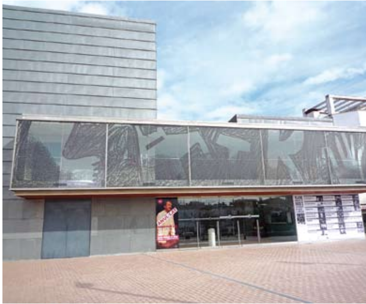
TEATRE DE ROSES. Es prepara per la celebració del desè aniversari

CANVI DE PORTA. L'entrada principal del teatre canviarà de sistema. La porta continuarà sent de vidre però serà corredissa. S'ha comprovat que en dies de tramuntana hi havia perill que el vidre es