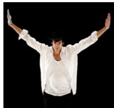
MICHAEL. Un dels alter ego de Jackson

L'obra es presenta dissabte (21 h) al Teatre Municipal de Ro-