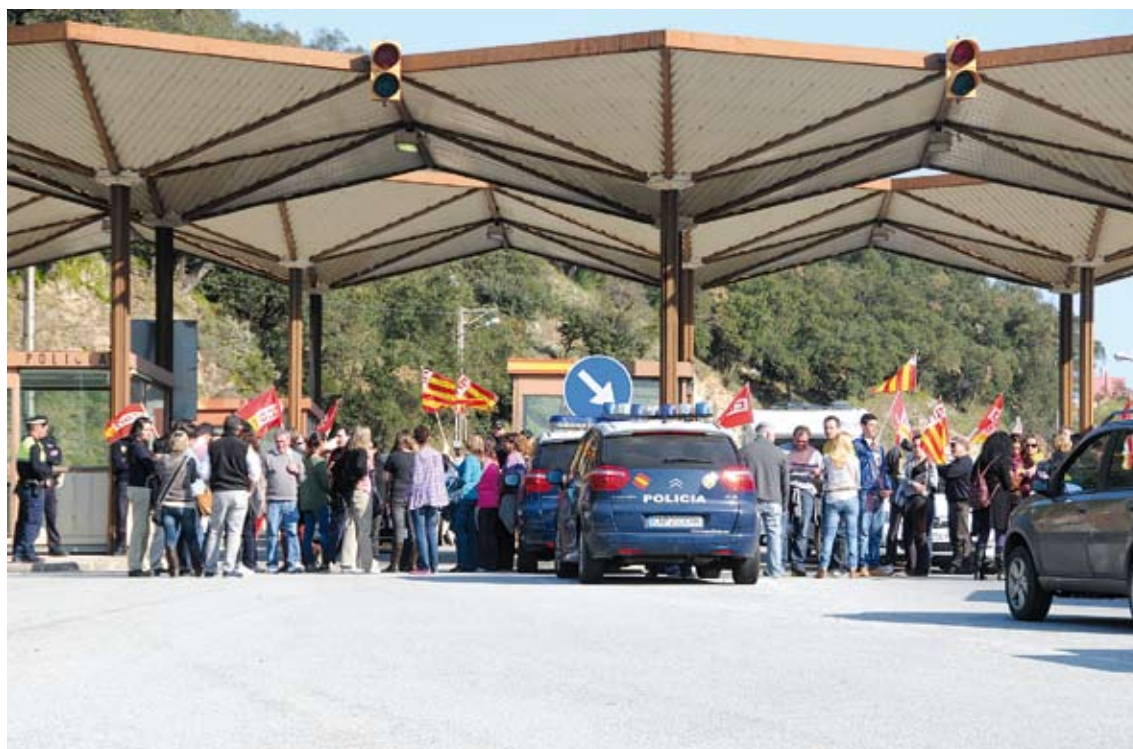
LA JONQUERA. Un grup de treballadors va tallar l'N-II a la Jonquera i al Pertús, i un grup de bombers va fer el mateix a l'AP-7