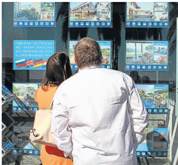
Immobiliària de Lloret especialitzada en la venda a estrangers

Majoritàriament són francesos, seguit de russos, anglesos i holandesos. "Quan es va crear la marca Costa Brava, el client també era francès", recorda el president dels API