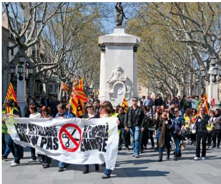
FIGUERES. Centenars de persones es van manifestar pel centre de la ciutat ÀNGEL REYNAL

En l'àmbit administratiu, van fer vaga el 7% dels funcionaris de l'Estat a la demarcació, el 8% dels treballadors del Consell Comarcal de l'Alt Empordà i el 10% dels empleats de l'Ajuntament de Fi-