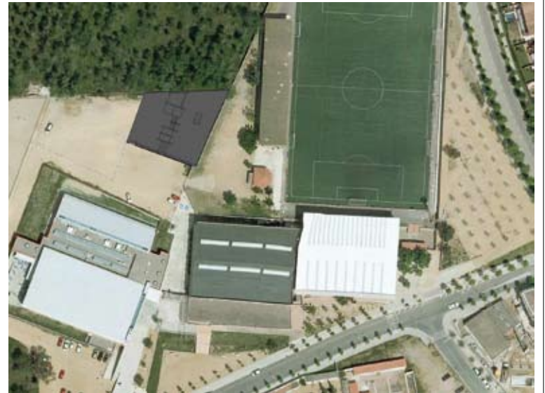
L'ANTERIOR PROJECTE. Del Mas Oliva a la zona del nou Vayreda