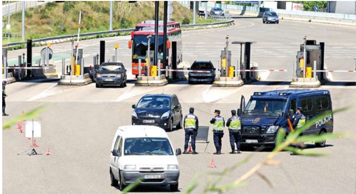
LES 24 HORES DEL DIA. Hi ha hagut controls als passos fronterers de l'AP-7 i l'N-II a la Jonquera, i de l'N-260 a Portbou. ÀNGEL REYNAL

Una de les actuacions més destacades va tenir lloc a Portbou, on els agents van confiscar diversos objectes a una parella de joves alemanys que viatjaven amb una furgoneta. Entre el material hi havia un bidó de gasoil, torna-