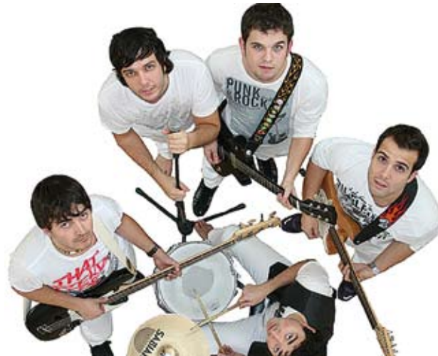
WANTUN. Els blanencs actuen dissabte al Sindicat

D'altra banda, dissabte (23 h), i ja seguint amb el cicle de concerts habitual, serà el torn dels Wantun, el grup indie-pop de Blanes. Wantun ha canviat diverses vegades de components, però això no ha estat un impediment per editar als estudis Blind Records el seu primer disc Ani-