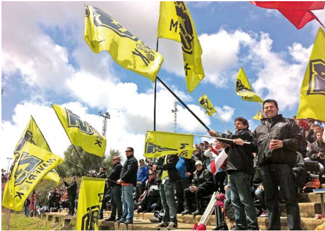
AFICIÓ. Les banderes verdes amb el 25 de Maverick Viñales van onejar el passat cap de setmana al circuit de Jerez