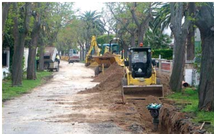
SECTOR MONTGRÍ. Ja s'hi estan reasfaltant els trams afectats per les obres

■ Després de 4 anys d'obres, en els propers dies es començaran a fer les primeres proves de l'estació de bombeig del nou clavegueram d'Empuriabrava. I és que tal com ha confirmat l'Ajuntament de Castelló d'Empúries, els treballs avancen seguint el ritme previst i està calculat que s'enllesteixin a principis d'aquest mes de maig. Demoment, l'empresa Aqualia està reasfaltant diversos carrers del sector Montgrí que s'havien obert per instal·lar-hi les noves canonades. ■