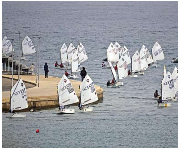
OPTIMIST. Una imatge d'una de les regates disputades a Roses

Durant quatre dies, més de 300 regatistes van competir en trapezis, triangles, recorreguts entre boies, travesses i, la novetat, el cross sai-