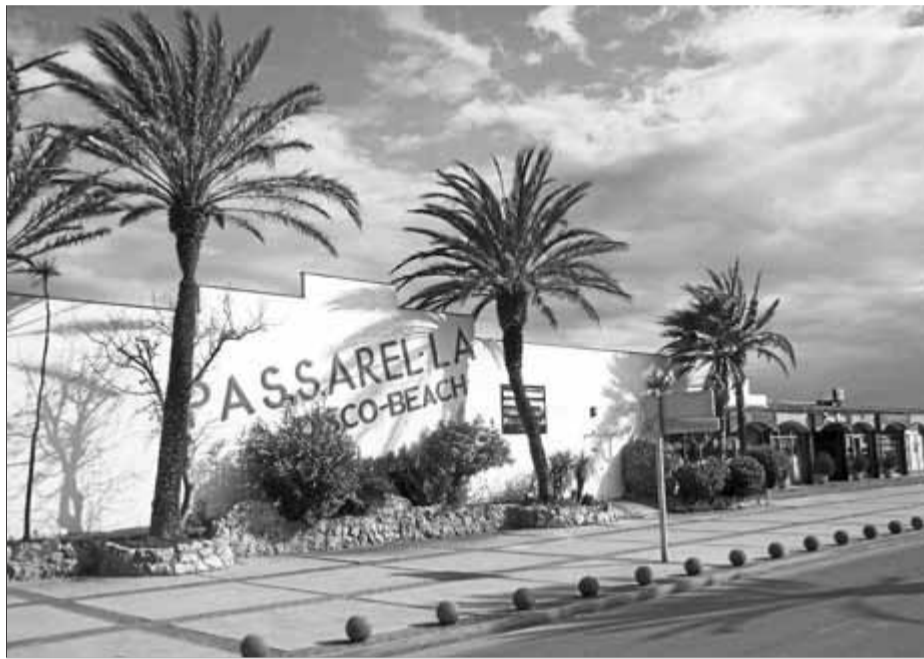
Passarel·la podrà obrir aquest estiu i s'enderrocarà a final de temporada ■ EL PUNT AVUI

D'aquesta manera es tanca la incògnita sobre els equipaments del passeig d'Empuriabrava per a aquesta temporada 2012: la concessió vigent va caducar l'any passat i implicava que es retornés la platja al seu estat original, o sigui que s'enderroquin els edificis. En vista d'aquesta situació l'Ajuntament de Castelló d'Empúries va obrir un concurs per a l'explotació de vuit noves guinguetes que s'oferien al millor postor a canvi d'un lloguer de