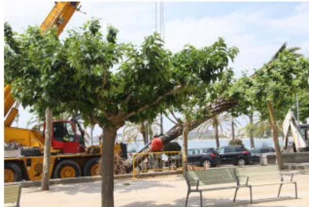
Aquest arbrat es reposarà a altres espais del passeig on les palmeres havien desaparegut Ajuntament de Roses

EMPORDA.INFO Aquest dimecres al matí s'han iniciat a Roses les tasques d'enretirada de 5 palmeres situades a la vorera de l'Av. de Rhode (cantó muntanya), a la seva alçada amb la plaça Catalunya. L'actuació respon a una doble necessitat, per una banda millorar el pas peatonal i l'accessibilitat en aquest punt del municipi, i de l'altra reposar aquest arbrat a altres espais del passeig on les palmeres havien desaparegut.