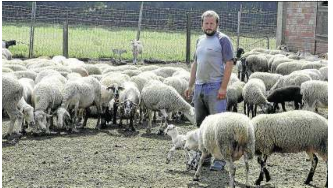
El pastor amb el ramat a la seva granja.

Des que té els dos gossos de vigilància, els robatoris es van aturar. En aquesta ocasió el robatori s'ha produït a la segona finca on té animals, a Llers. Aquí té uns 400 caps de bestiar, 80 de les quals són xaies que van amb la mare, explica, que les deixa en aquest indret perquè hi ha herba abundant per pasturar, ha explicat. Fa tres setmanes a primera hora del matí quan es va adreçar a la finca es va