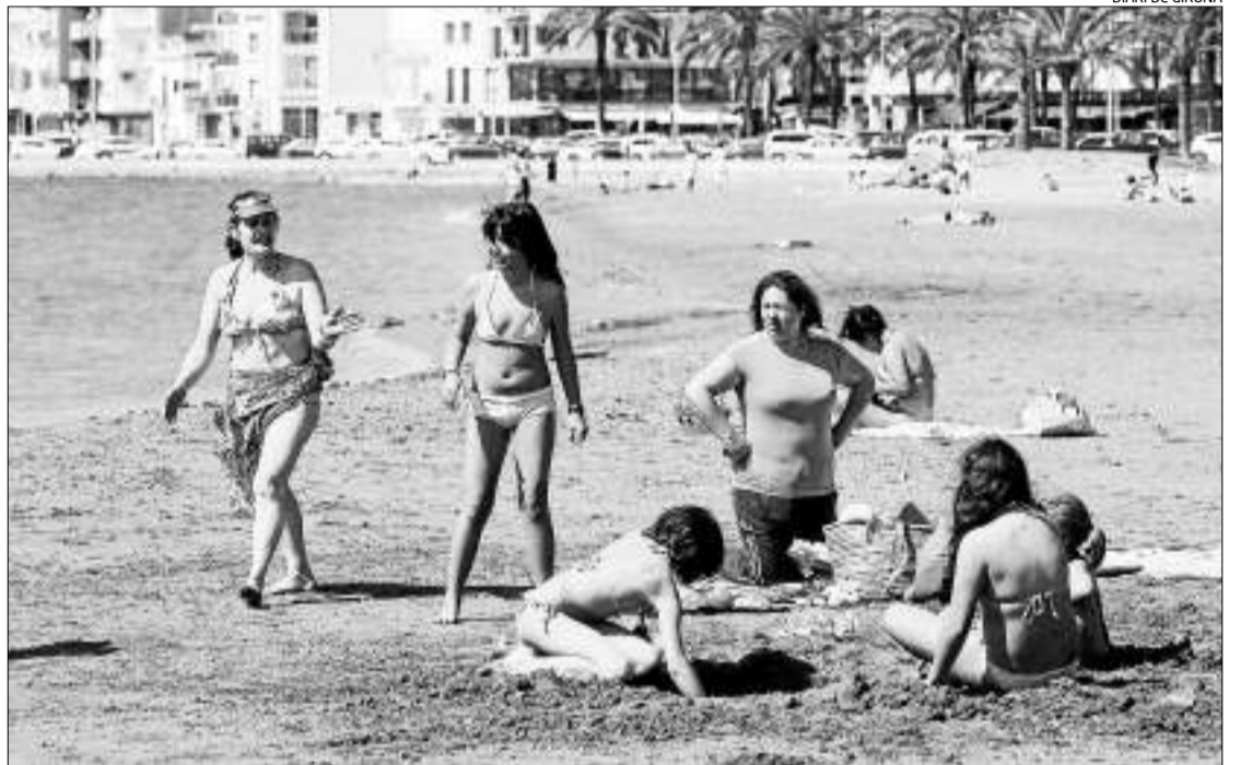
DIARI DE GIRONA

Les platges gironines comencen a omplir-se de turisme en espera que l'estiu salvi la temporada.