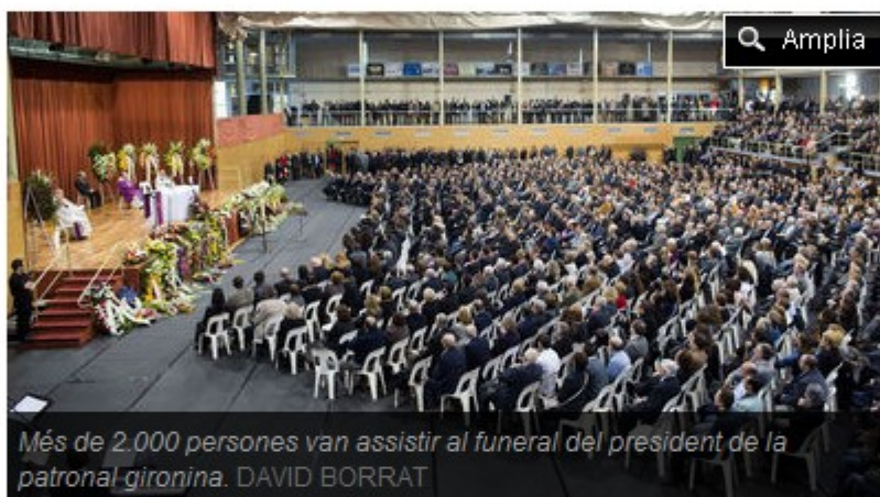
Més de 2.000 persones van assistir al funeral del president de la patronal gironina. DAVID BORRAT

Un dels nebots va descobrir el saqueig i va presentar la denúncia als Mossos d'Esquadra que estan investigant els fets i intenten localitzar els autors, tot i que descarten ja que tingui cap vincle amb l'assalt que va patir l'empresari mort. Des del passat dilluns, quan es va conèixer la notícia de la mort del president de la patronal gironina, els Mossos d'Esquadra van reforçar la vigilància i els controls a la Costa Brava i especialment a la zona de Platja d'Aro.