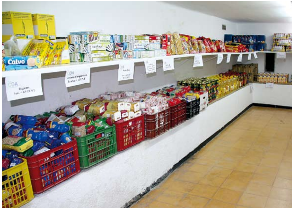
CENTRE DE DISTRIBUCIÓ D'ALIMENTS. El futur economat de Roses tindrà una gestió semblant al de Girona

La idea és traslladar l'esquema de funcionament de Girona a la proporció i necessitats de Roses, on es calcula que "més d'un miler de persones reben ajuts per alimentació i productes de primera necessitat". Tot i això, "la xifra tampoc és exacta, podria ser superior-afegeix Danés- perquè són diverses les vies per obtenir ajut i ara es pretén que amb el nou sistema tot quedi unificat pels Serveis Socials de l'Ajuntament i les dades siguin més transparents".