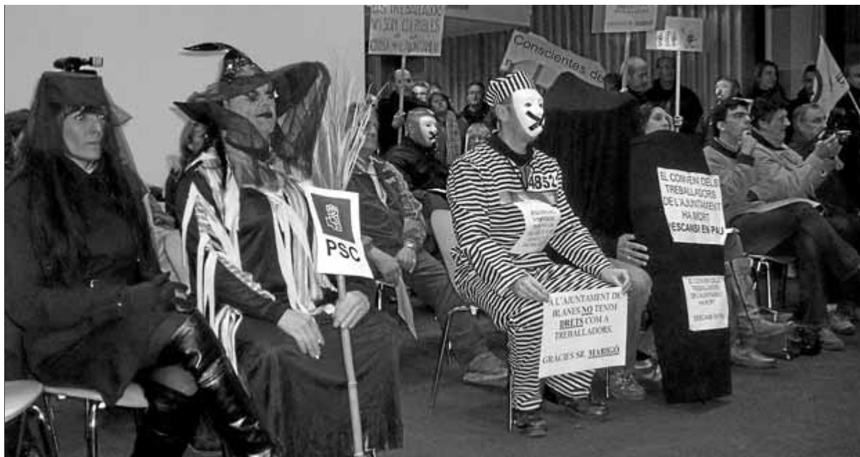
Els treballadors municipals de Blanes van traslladar la protesta d'ahir a la sessió plenària