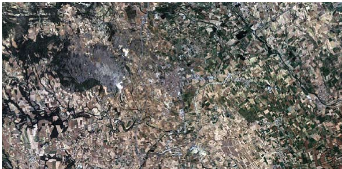
IMATGES. Dues fotografies recents -a dalt, de tota la comarca, i a sota, de la ciutat de Figueres- vistes des del satèl·lit

lucions de la desembocadura de la Muga o del Fluvià, el creixement urbanístic de Figueres o el desenvolupament de les urbanitzacions d'Empuriabrava, Llançà, Roses o Palau-saverdera, per posar uns quants exemples. El servidor, anomenat SatCat, es pot consultar a través de la pàgina web http://opengis.uab.cat/wms/satcat/index.htm .