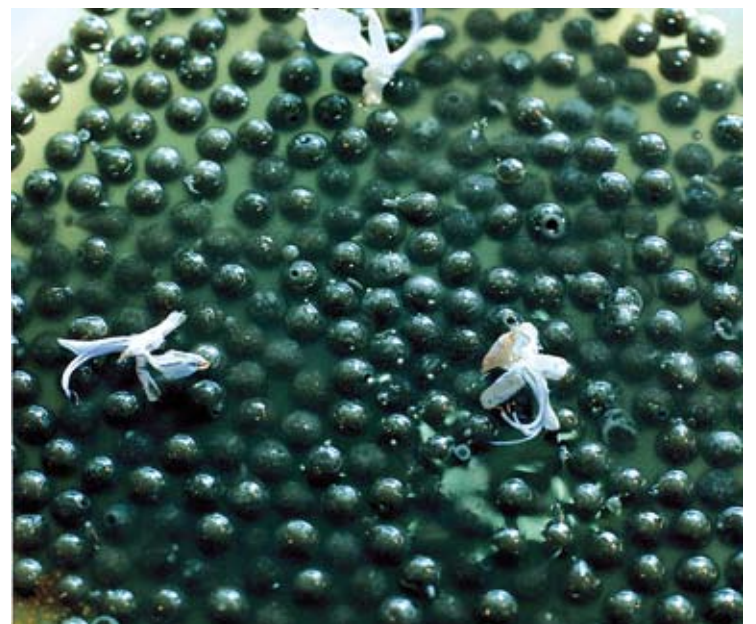
ABSTRACCIONS. Algunes de les imatges de Collins, tot i ser bodegons compostos amb aliments, s'apropen més a l'art abstracte que al figuratiu