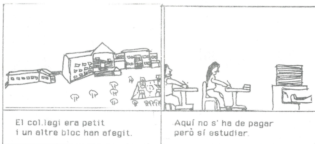
Fragment de l'auca de l'escola on s'explica l'ampliació del centre i que per estudiar no s'ha de pagar en contraposició a un dels altres centres de la vila

A manca d'una recerca exhaustiva sobre el centre, se sap que el 1975 aquest s'estava edificant per acollir l'augment de la població escolar de Roses, al mateix temps que l'Escola Ruiz Amado de Castelló d'Empúries, inaugurada aquesta segona el 1976. Es va construir prop de la carretera de les Arenes, al costat de la zona de creixement de l'eixample dels anys seixanta i setanta entre la Ciutadella i la Gran Via de Pau Casals. Amb la seva construcció Roses passava a tenir un segon centre d'ensenyament públic, a banda de l'Escola Narcís Monturiol (1936). Ben aviat, el 1977 es va ampliar l'escola amb aules per a parvulari i EGB per donar resposta al ràpid creixement demogràfic de la vila. De nou, a mitjan dels anys noranta es va fer una nova ampliació del segon centre d'ensenyament públic de Roses. Amb tot, la història de l'ensenyament a Roses encara està per fer.