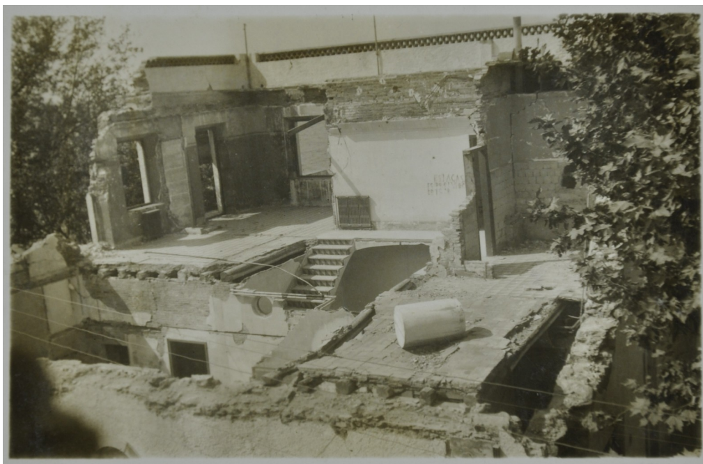
Vista de l'interior de la casa des d'un balcó veí