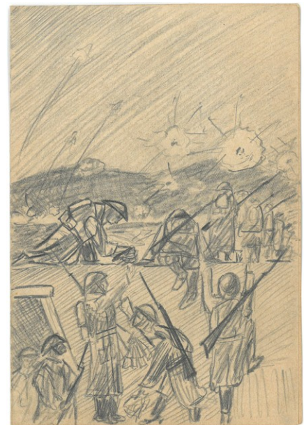
Escena de guerra