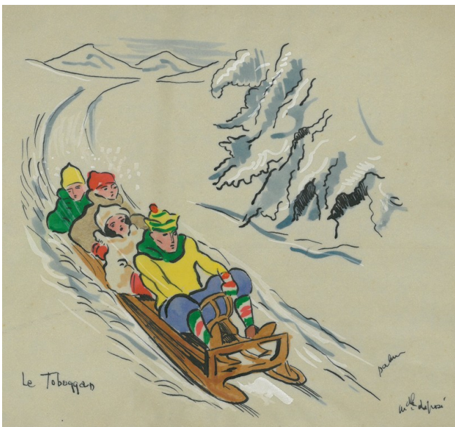
Detall de la portada d'un àlbum de fotos

Els altres dos dibuixos destacats són de temàtiques ben diferenciades. Un és de la portada d'un àlbum de diversos viatges fets per la parella per Catalunya i Andorra. Hi ha una perspectiva d'un entorn muntanyós i quatre persones fent un descens amb un trineu amb el títol "Le Toboggan". L'altre és un dibuix fet a llapis que descriu una escena de guerra, potser, per la vestimenta, de la Gran Guerra (1914-1918) on hi ha moviments de tropes i atacs d'artilleria.