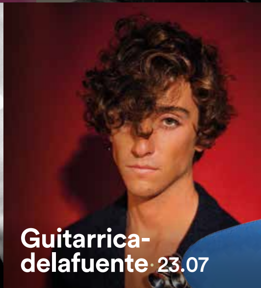
Guitarrica-delafuente · 23.07