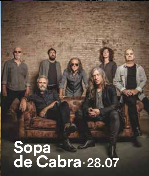
Sopa de Cabra · 28.07