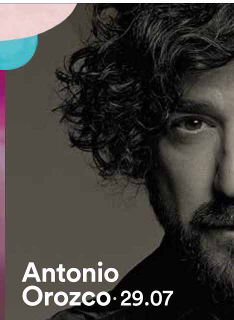
Antonio Orozco · 29.07