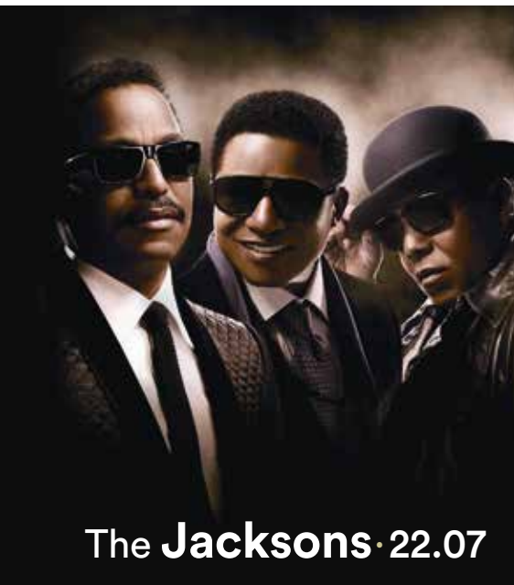
The Jacksons · 22.07