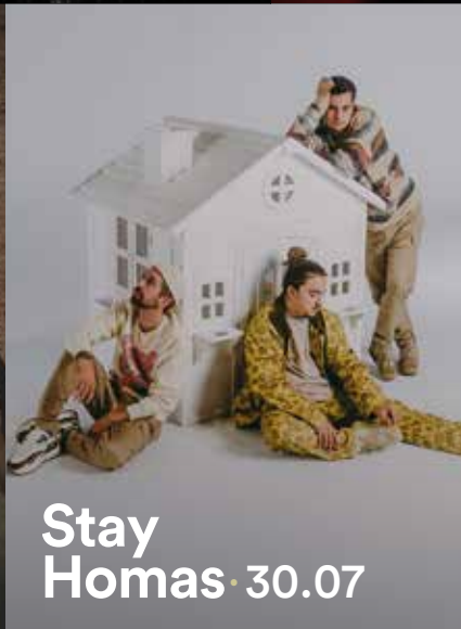
Stay Homas · 30.07