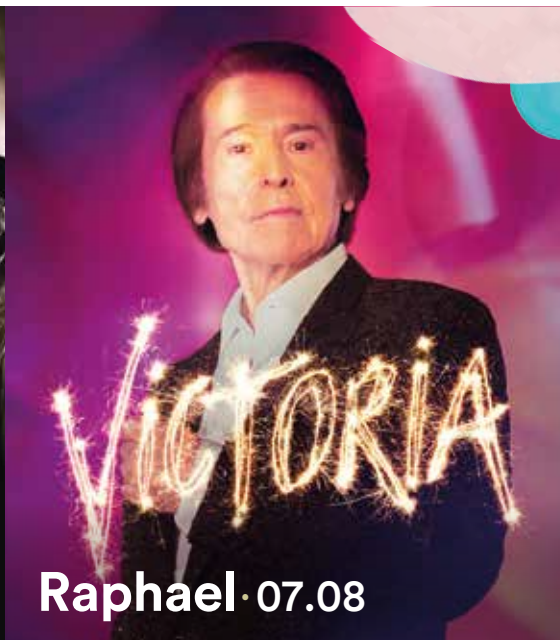
Raphael · 07.08