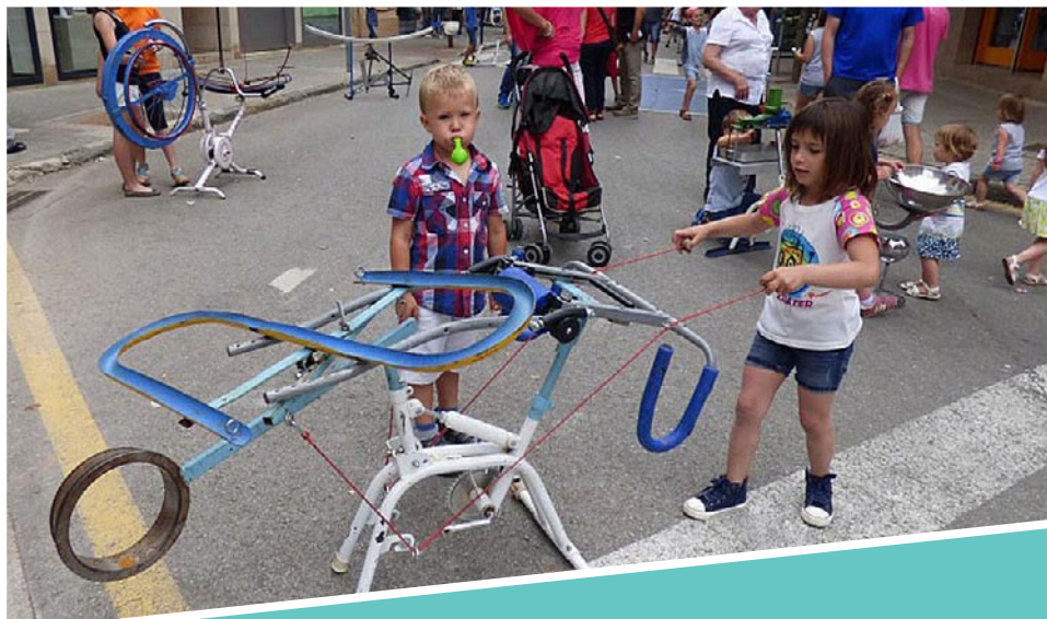
Gargot picat 27 abril