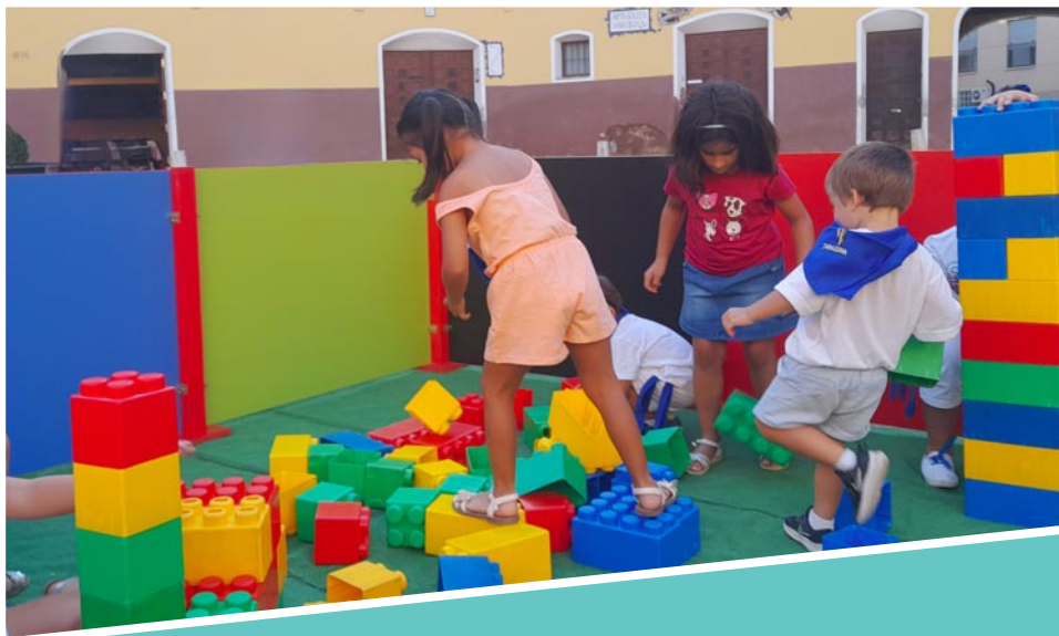
Tancats de construcció per als més menuts 4 maig