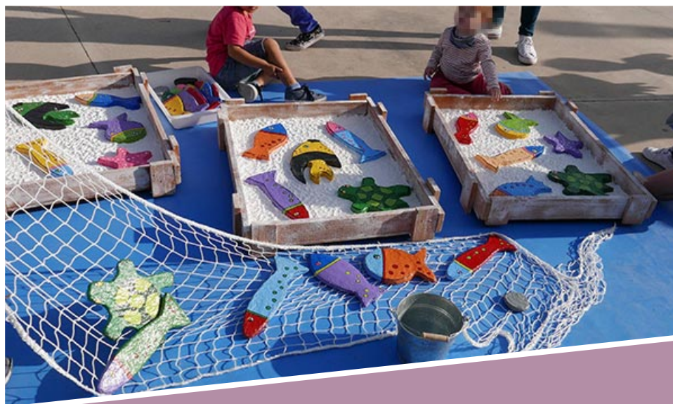
Peixos de colors 28 octubre

* En cas de mal temps, l'activitat es realitzaria a la Sala d'Exposicions de la Ciutadella.