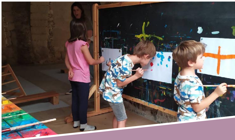
Taller de pintura vertical 21 octubre