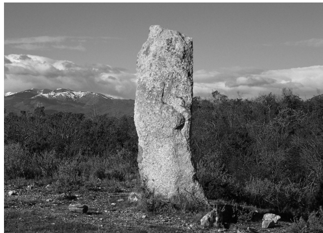
Menhir de Vilartolí (Sant Climent Sescebes)