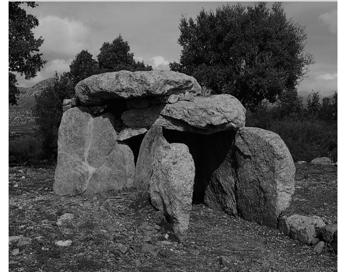
Dolmen de la Cabana Arqueta (Espolla)