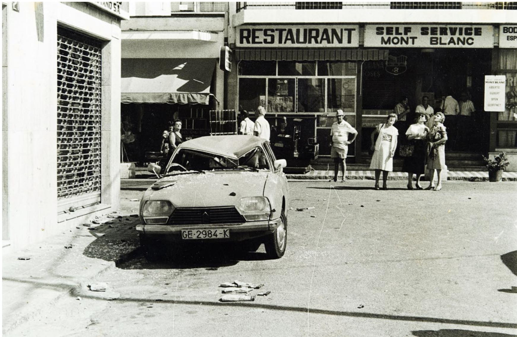
Reg. 174. Autor: Xevi Ruiz. 14 d'octubre de 1986.

El títol: Vianants observant un cotxe afectat per la caiguda d'una cornisa. / L'altre títol: Tres senyores grans mirant com plouen rajols.