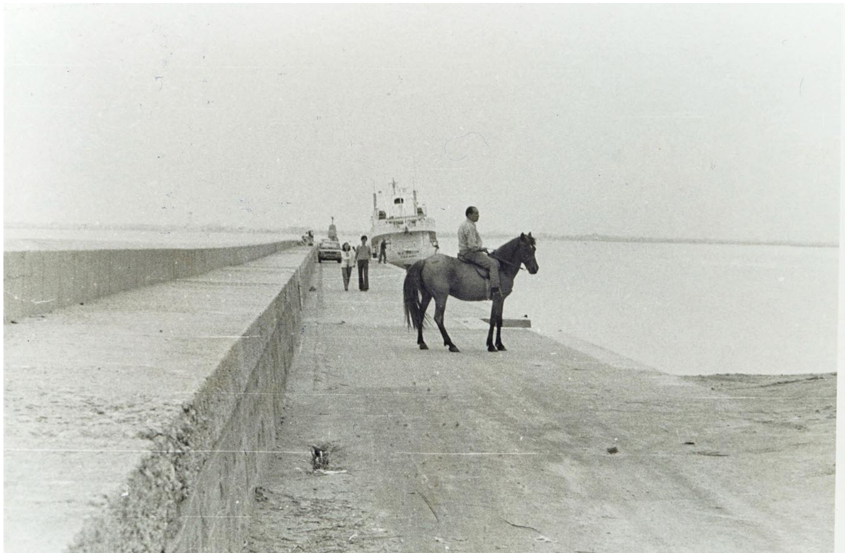
Reg. 633. Autor desconegut. 1979-1982.

El títol: Escena pintoresca a l'espigó del port pesquer. / L'altre títol: Un cavall, un cotxe semiabandonat i el vaixell Orion.