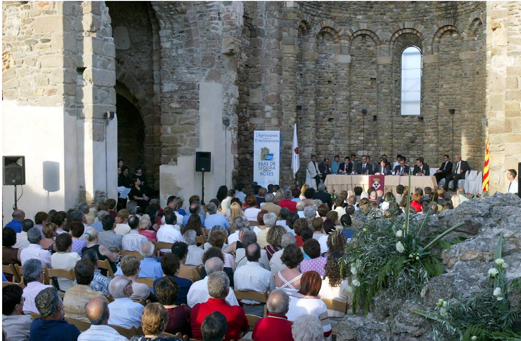
Reg. 11881. 15 de juny de 2002 Signatura de l'agermanament entre Roses i Beas de Segura