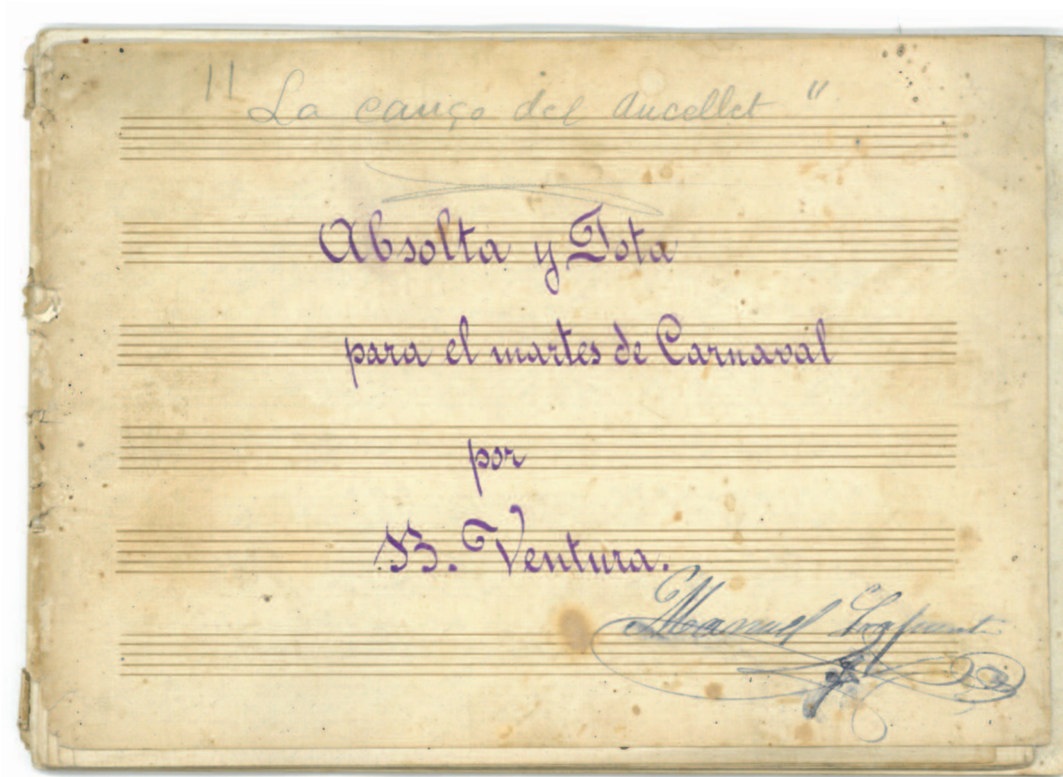
Partitura d' Absolta y jota para el martes de Carnaval , de Pep Ventura.