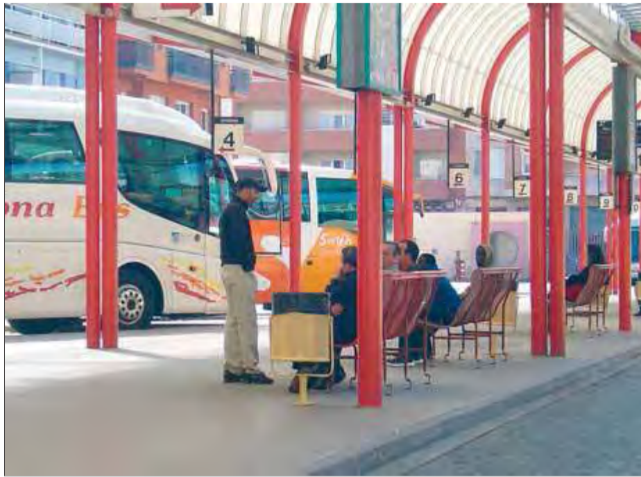
La inspecció per localitzar el suposat artefacte va tenir lloc a l'estació de busos ■ MAR VICENTE

La seva detenció es va dur a terme a Figueres. Des d'un primer moment, el jove va reconèixer que havia estat ell qui havia trucat i va manifestar que la seva intenció era fer "una broma". La policia el va denunciar per un delictes de desordres públics. S'intenta-