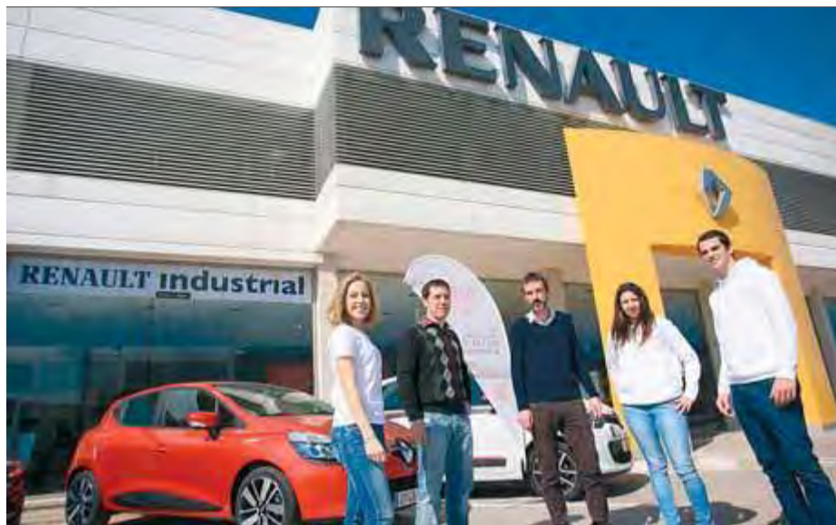
Renault fa avui i demà una jornada de portes obertes a Fornells de la Selva

La marca donarà a conèixer als clients entre avui i demà les novetats tecnològiques en la gamma Renault a les instal·lacions de Fornells