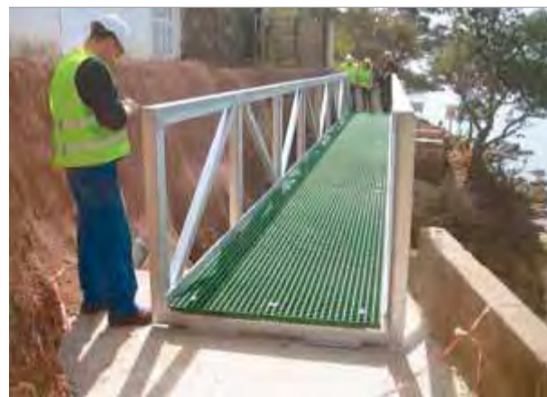
EL PUNT AVUI

També van guardonar la xarxa d'instituts de recerca europeus en fruita Eufria, en la categoria de recerca i innovació, i l'Agrupació de Defensa Vegetal del Poal, en la categoria d'aplicació i transferència tecnològica. ■ I.B.