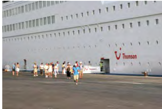
Vaixell al port de Palamós GENCAT

EMPORDA.INFO Costa Brava Cruise Ports i Delta Ebre Port promouen els tres ports i les seves destinacions a la fira més rellevant del món per consolidar les companyies de creuers actuals i captar-ne de noves La Generalitat de Catalunya, a través de l'empresa pública Ports de la Generalitat, participa la setmana vinent amb els ports de Palamós, Roses i Sant Carles de la Ràpita i els seus entorns turístics a l'aparador internacional més important del sector al Seatrade Cruise Shipping Miami, que se celebrarà del 16 al 19 de març a Miami Beach (Estats Units), amb l'objectiu d'impulsar l'arribada de creuers a la Costa Brava i al Delta de l'Ebre.