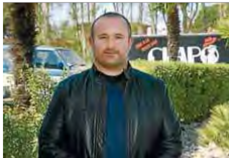
Alguns candidats que repeteixen: els de Roses, Castelló, la Bisbal i Santa Cristina