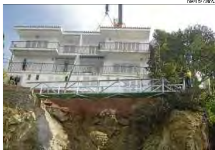
La instal·lació de la passera metàl·lica a Roses.

La passera metàl·lica té 14 metres de llargada, 1,2 metres d'amplada i pesa 2,5 tones. Amb una grua es va anar ubicant sobre la roca del front litoral que el nou pas elevat permetrà salvar si es vol recórrer a peu el camí. L'anterior estructura es va haver d'enderro-