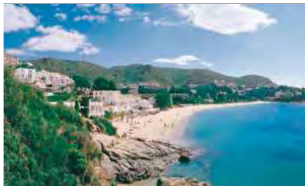
La platja Almadrava de Roses és una de les que s'inclouen en el catàleg publicat pel Patronat de Turisme ■ EL PUNT AVUI

Seixanta-set platges i cales de vint-i-tres municipis de la Costa Brava es presenten en un catàleg promocional del Patronat de Turisme Costa Brava Girona de la Diputació de Girona. El catàleg incorpora una selecció de platges i cales amb una fotografia identificativa, una descripció i pictogrames amb informació útil per a l'usuari, com ara longitud