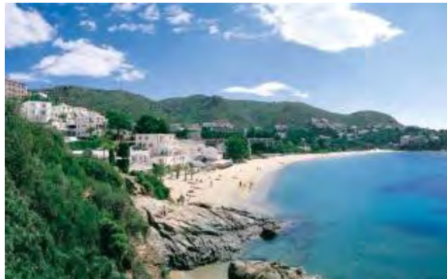
Imatge promocional de l'Almadrava PTCBG

EMPORDA.INFO Seguint amb la creació de nous materials promocionals de la destinació Costa Brava, el Patronat de Turisme Costa Brava Girona de la Diputació de Girona edita el catàleg que ofereix informació de seixanta-set platges i cales de la costa gironina que s'ubiquen al llarg de dos-cents vint quilòmetres de litoral. La publicació incorpora una selecció de nord a sud de la Costa Brava,