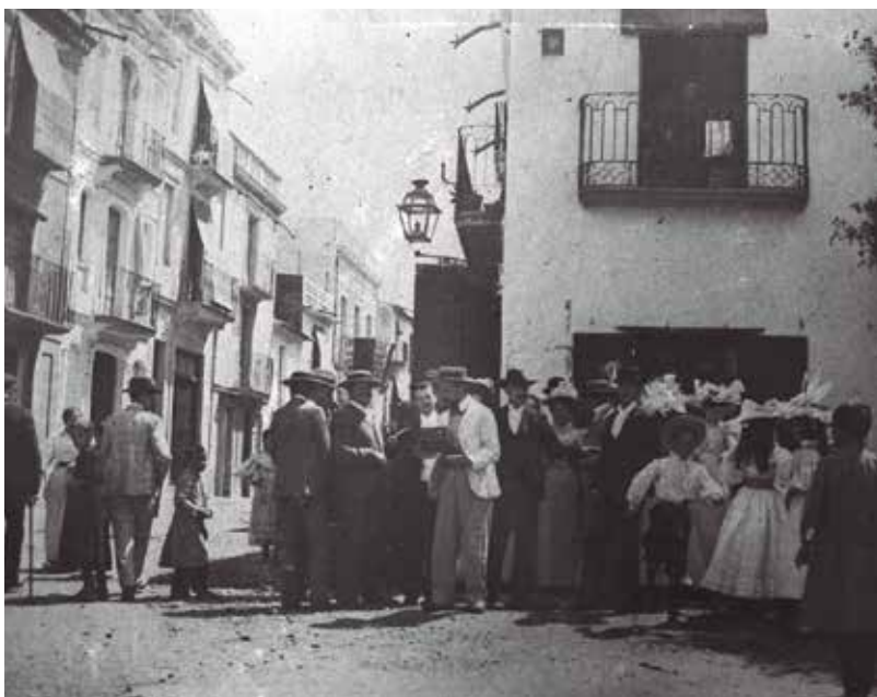
Fanal probablement de petroli al carrer de davant, actual Pi i Sunyer/AMR (Col·lecció Reixach)