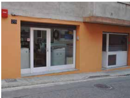
CAT AMR 16.1. Col·lecció municipal d'imatges, Façana de l'Arxiu Municipal al carrer de la Mainada a, 22 d'abril de 2015.

de segle que permet restituir la forma original d'un lloc; uns plànols que poden estalviar una feïnada a un delineant o un aparellador; un expedient administratiu que garanteix els drets d'una persona. La casuística seria infinita, com ho són les consultes que durant 25 anys ens han fet, algunes de ben curioses, com saber quin dia de la setmana va caure el Divendres Sant de 1957 o una senyora que volia consultar els plànols de casa seva, però... no sabia el nom del carrer on vivia! Tant se val. L'AMR connecta les necessitats del present amb les fites del passat per acabar construint el futur proper. Aquest trajecte duu