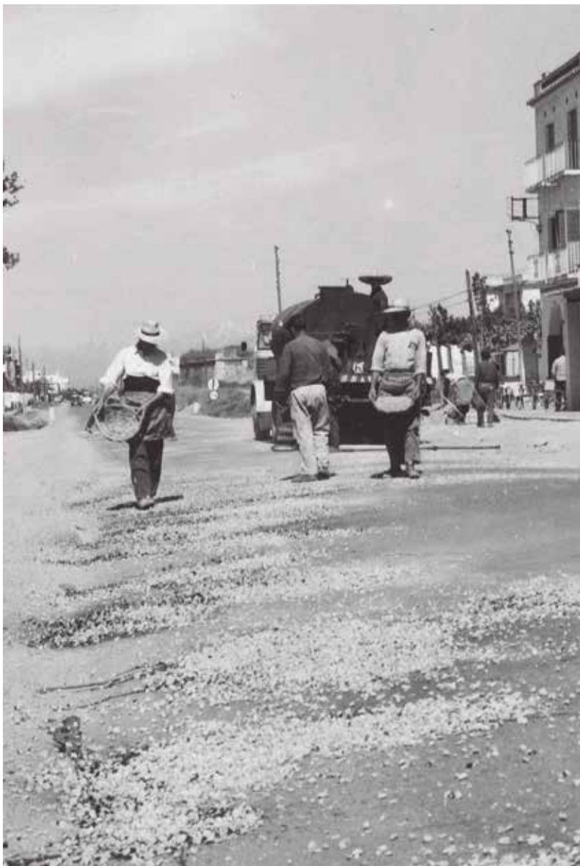
A la cantonada de l'Hotel Marina, tipologia de fanal de meitat dels anys 60.