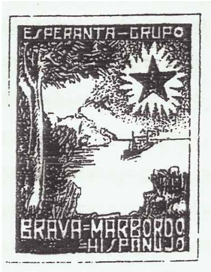
Segell distintiu de l'entitat

L'esperantisme va ser un moviment mundial que va tenir lloc, sobretot, durant el primer terç del segle XX. A Roses, tot i que més tardanament, també hi tingué nombrosos seguidors. Eren els nois de l' Esperanta Grupo Marbordo , el grup esperantista Costa Brava, del qual actualment queden poques traces però suficients per resseguir el seu ideari i les motivacions dels seus membres.