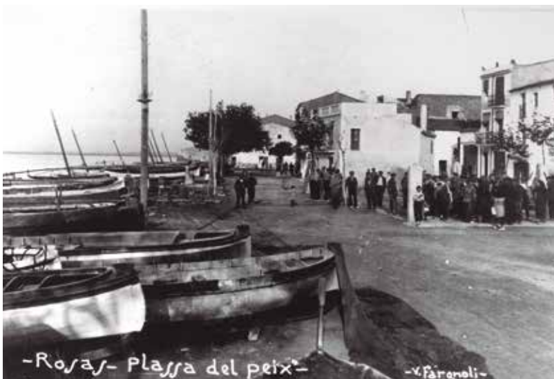
Fanal elèctric a davant de la plaça del Peix vella

La modernitat i el canvi social que suposa la presència d'un sistema d'il·luminació públic als carrers arribà a Roses en algun moment del final del segle XIX. Tot i que se'n desconeix la data exacta, l'enllumenat públic de Roses va ser més tardà que el d'altres municipis de la comarca. Tanmateix, des del moment de la seva implantació, les instal·lacions a la vila han mantingut un progrés ascendent tant en nombre de fanals com en les noves tecnologies que s'hi han anat implantant perquè aquests fossin més eficients.