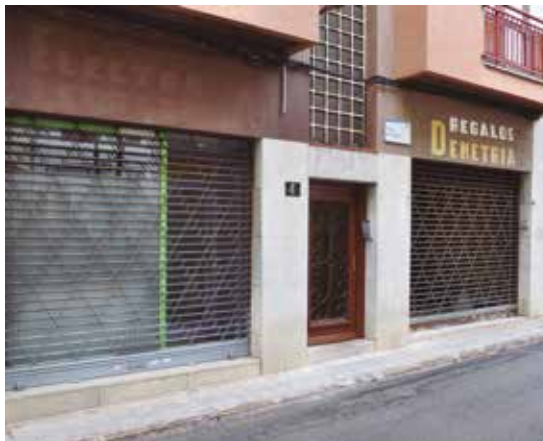
CAT AMR 16.1. Col·lecció municipal d'imatges, Façana dels dipòsits de prearxivatge de l'Arxiu Municipal a la plaça de l'Àngel, 16 d'abril de 2015.

consisteix en la seva neteja i desinsectació per millorar el seu estat de conservació. Un cop fet aquest primer pas es classifiquen i es descriuen perquè siguin accessibles als ciutadans. Des de 1992 s'han efectuat més d'una seixantena de donacions que han conformat un corpus documental bàsic per conèixer Roses més enllà de la memòria institucional que ens aporta el fons municipal. La gratitud ha de ser eterna per a totes aquelles persones, doncs, que han donat documentació a l'AMR. Tots ells han fet més gran i més interessant el seu poble. Més de vuitanta