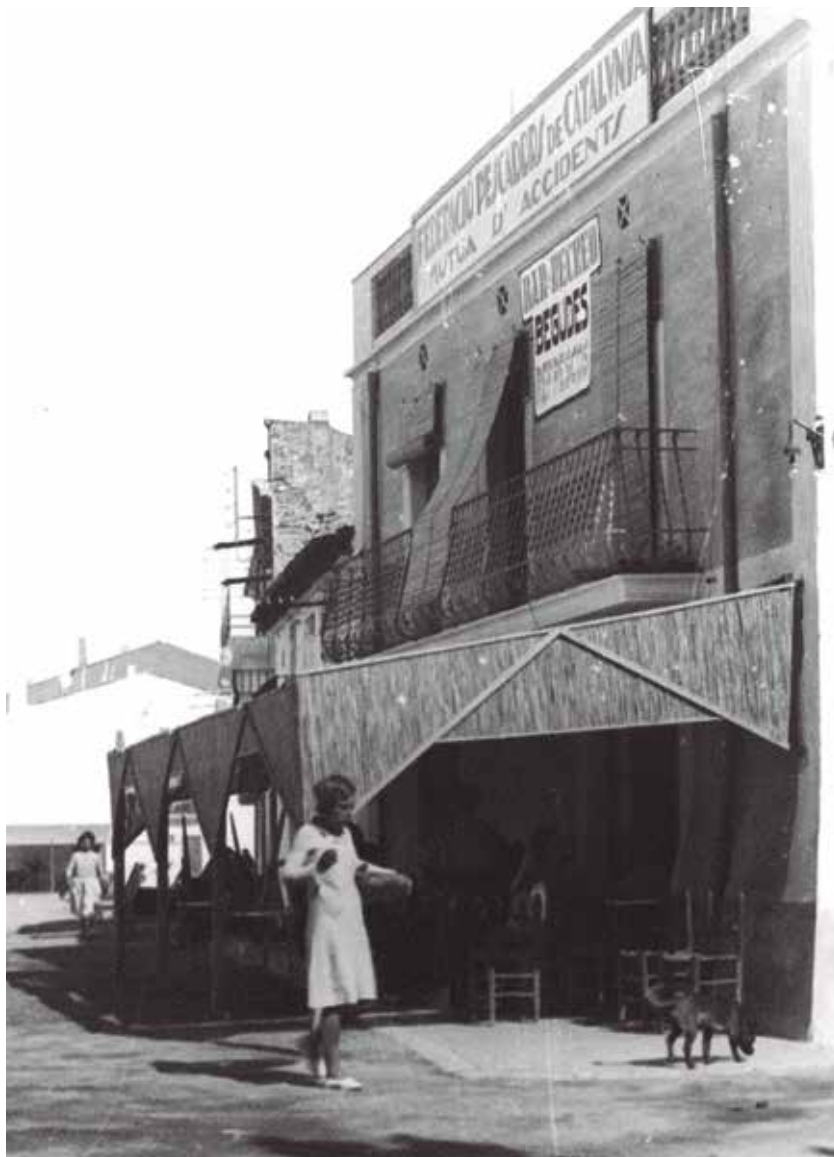
A la cantonada hi ha un fanal elèctric amb la bombeta descoberta. /Fons Francisco-Giró - Autor: Francisco Sanpera Mora

para nuestra población, ya que tenemos la línea telegráfica del Estado que nos comunica con los Centros de mayor relación... [3]