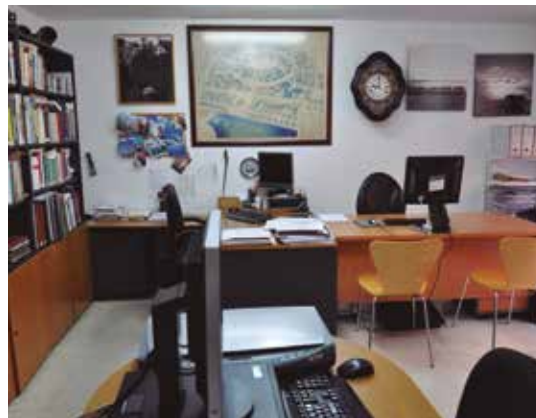
CAT AMR 16.1. Col·lecció municipal d'imatges, Sala de treball i consulta de l'Arxiu Municipal al carrer de la Mainada, 29 de juny de 2016.

democràtica, basada en el servei al ciutadà, en l'aplicació d'uns criteris de transparència que, ho podem assegurar ara, fa més de dues dècades esdevenien uns paràmetres de gestió absolutament desconeguts i incompresos. D'aquesta manera, mai s'ha considerat com a propi ni un bolígraf: només era nostre l'ús d'aquest bolígraf que, en darrera instància, pertanyia a qui l'havia pagat, el poble de Roses. En el fons, és senzill: un arxiu és el garant final d'un sistema polític democràtic, és el servei on qualsevol ciutadà pot recórrer a consultar qualsevol assumpte públic que es tramita o s'ha tramitat a l'Ajuntament. Un arxiu és allò contrari